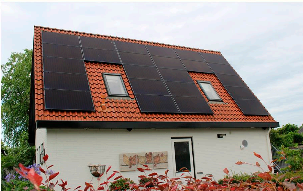
■ Er is veel winst te behalen bij het verduurzamen van woningen.